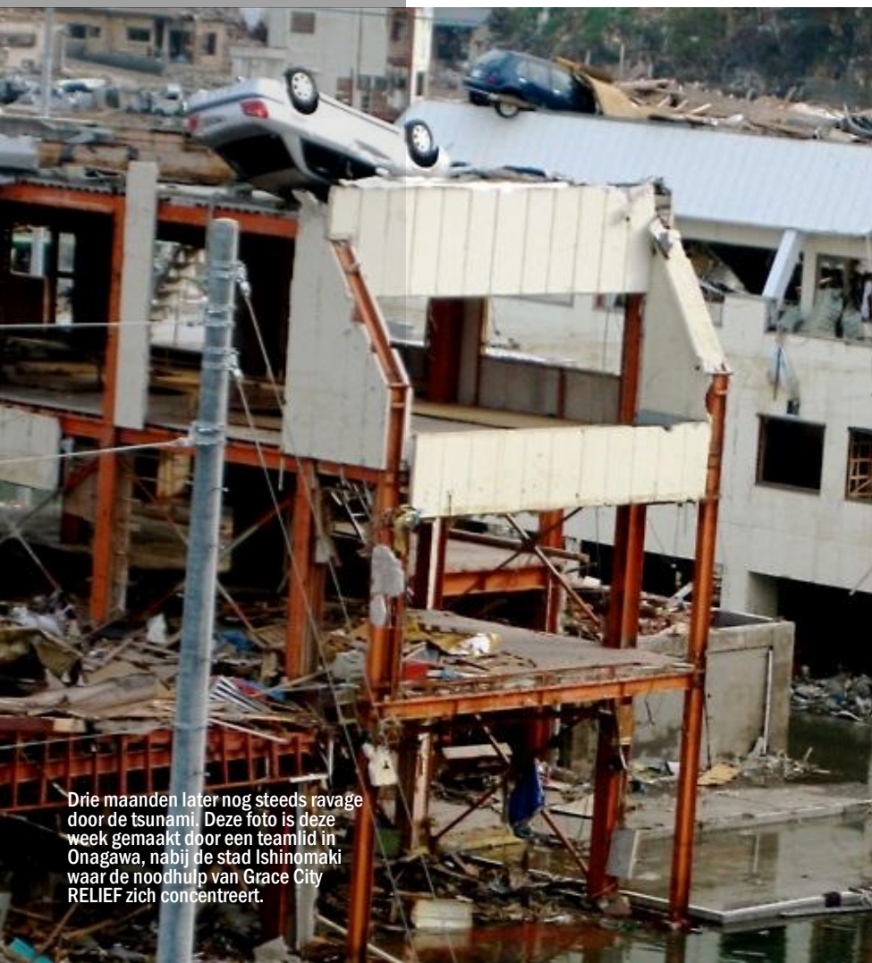
Drie maanden later nog steeds ravage door de tsunami. Deze foto is deze week gemaakt door een teamlid in Onagawa, nabij de stad Ishinomaki waar de noodhulp van Grace City RELIEF zich concentreert.