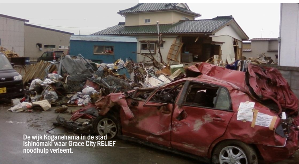
De wijk Koganehama in de stad Ishinomaki waar Grace City RELIEF noodhulp verleent.

Het was goed om weer bij jullie in Nederland te zijn en op adem te komen. Het weerzien met familie, vrienden, de gemeente, kinderen en juffen op school in Oegstgeest en met zoveel andere mensen die met ons meeleeften stak ons een geweldig hart onder de riem. Zo konden we half