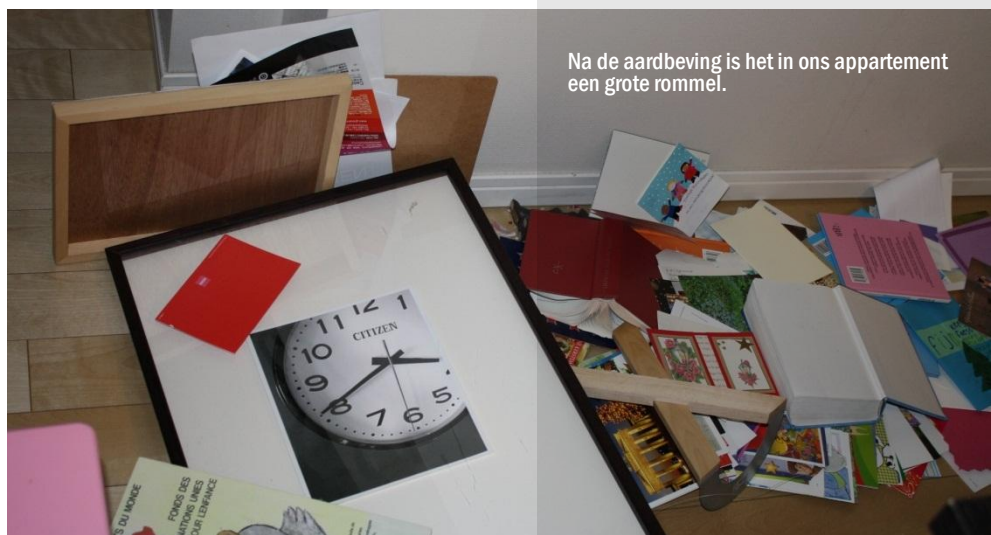
Na de aardbeving is het in ons appartement een grote rommel.

letterlijk. Het intensieve werk in Amerika hielp ons onze gedachten te verzetten en bood tussen de programmaonderdelen door tijd als gezin te beginnen met het verwerken. De keten van zorgwekkende gebeurtenissen rondom de kerncentrale was eind maart nog zodanig ernstig, dat in samenspraak met de GZB besloten werd om tijdelijk naar Nederland terug te keren. Het was moeilijk om niet meteen terug te gaan naar Japan, waar ons hart achtergebleven was en de nood zo hoog was. Inmiddels was er vanuit Grace City Church noodhulp op gang gekomen en brachten vrijwilligers vrachtwagens vol noodgoederen naar