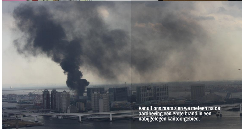
Vanuit ons raam zien we meteen na de aardbeving een grote brand in een nabijgelegen kantoorgebied.