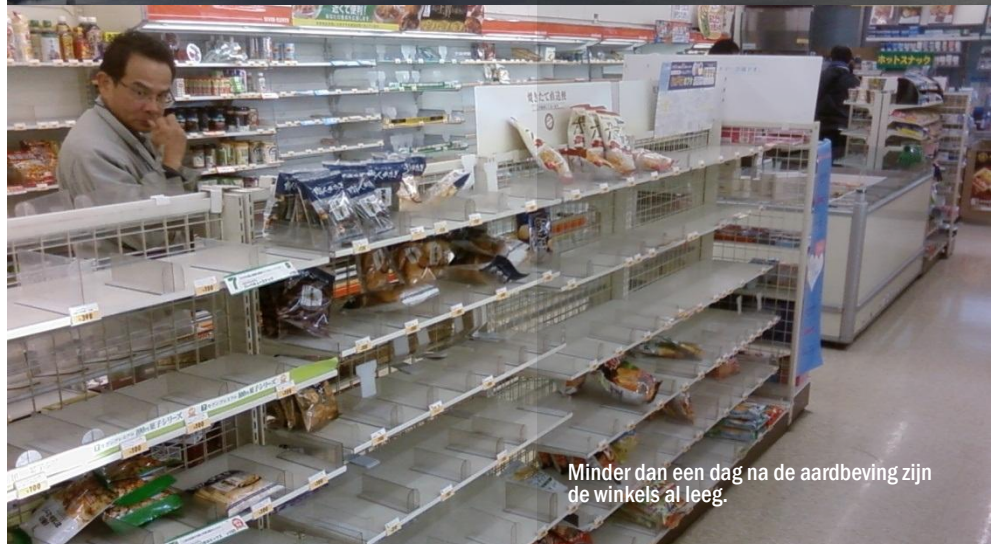
Minder dan een dag na de aardbeving zijn de winkels al leeg.